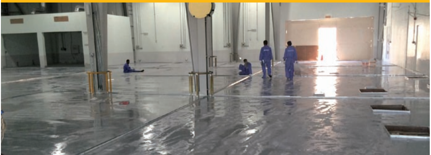
Applizierte Beschichtung im Werkstattbereich